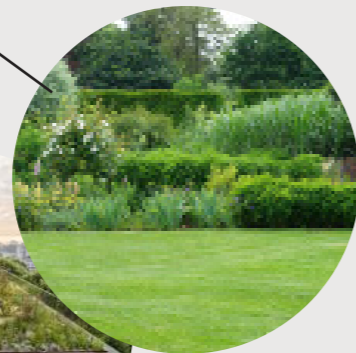
"Een onderhouden tuin"