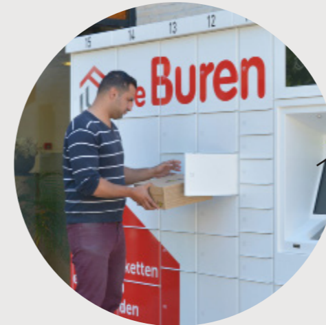
"Pakketkluis zodat bezorgers een pakket kunnen achterlaten"